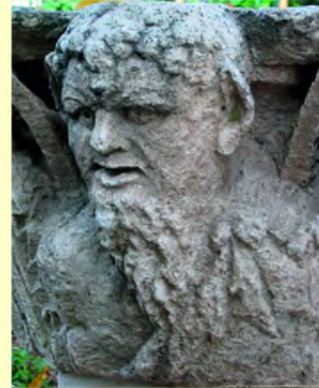
Sütunlu Cadde Figürlü Korinth Sütun Başlığı

Sütunlu Cadde'de opus sectileli taban döşemeleri, apsisi iki sütun arasında yerleştirilmiş küçük kilise ile altın takı koleksiyonu Erken Bizans Döneminin en önemli buluntularıdır. 525 depremi öncesine tarihlenirler.