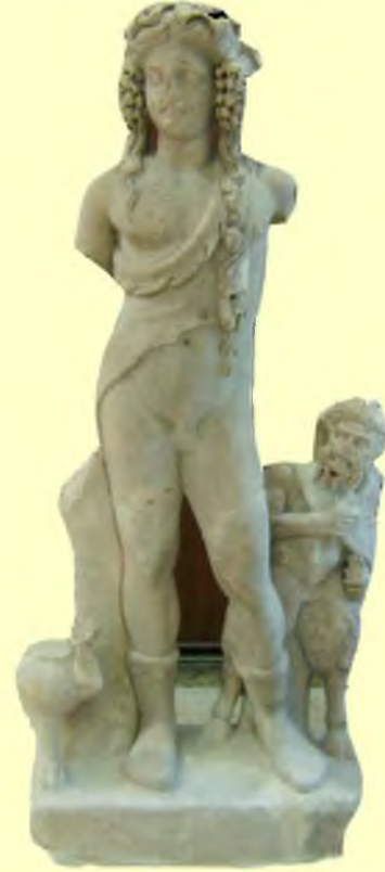
Roma Dönemi Dionysos-Pan-Panther Heykel Grubu

Sütunlu Cadde'nin benzerlerine Kilikia'da Diokaisarea, Hieropolis-Kastabala ve Anazarbus'ta; Suriye'de Apemeia ve Palmyra'da rastlanır. Doğuya özgü konsollar üzerindeki yazıtlar, Roma imparatorlarına ve imparator ailesinden kişilere, yüksek memur ve ileri gelenlere ithaf edilir. Yekpare ya da açılan bir niş ile tambura eklenmiş olarak bu konsollar iki