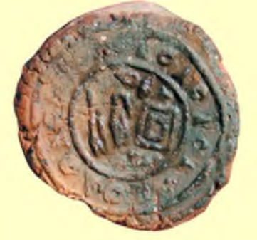
İ.Ö. 13. yy. Parnapi Mühür Baskısı