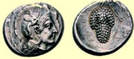
İ.Ö. 5. yy. Soli Sikkesi

Klasik Dönem daha az örnekle temsil edilmektedir. Kırmızı Figür tekniğinde yapılmış çıplak bir kadın karşısında elinde kutu ve keten tutan Eros betimlemeli seramik parçası ile Dionysos-Menad betimlemeli örnekler İ.Ö. 5-4. yüzyıl buluntularıdır.