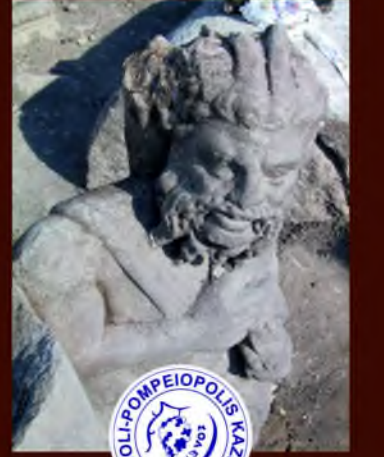
MEZİTLİ / MERSİN / TÜRKİYE