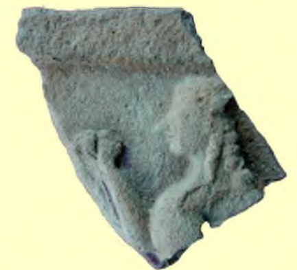
Arkaik Dönem Mimari Pişmiş Toprak Levha

Arkaik Dönemin başlıca grubunu; höyüğün batı ve doğu yamacı açmalarında bulunan mimari terra cottalar oluşturmaktadır. Karşılıklı sfenks, erkek figürlü kabartmalı levhalar, lotus-palmet kabartmalı tepe kiremiti, volütlü palmet desenli antefiks parçaları, meander kabartmalı sima parçaları, çörten vb. Kilikia'da ilktir ve Soli akropolünde yerleşik Grek kolonistlerin (apoikia) varlığını ve aynı zamanda Grek kolonizasyonunun doğu sınırını göstermektedir. Ayrıca İ.Ö. 7. yüzyıl Kuşlu Kaseler, Yaban Keçisi Stili oinokhoe parçaları, İ.Ö. 6. yy. dalga bezemeli örnekler, İonia Kaseleri, Doğu Grek lebesleri, Korinth Seramiği parçaları, Rodos-Lindos kolonisi olarak bilinen Soli' nin İ.Ö. 7-6. yüzyılda Grek dünyası ile olan yakın ilişkilerini kanıtlamaktadır.