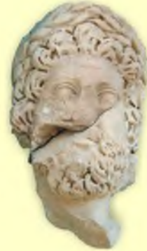
Roma Dönemi Asklepios Başı

Yaklaşık 350 m. uzunluğunda kentin ana eksenini oluşturan ve Doğu geleneğini yansıtan Pompeiopolis Sütunlu Caddesi'nin günümüzde 33 sütunu kısmen ayakta kalabilmiştir. Caddede görünürdeki bütün mimari parçalar (sütun kaidesi, sütun tamburu, sütun başlığı, friz ve korniş) deprem nedeniyle yıkılarak çevreye dağılmış durumdadır.