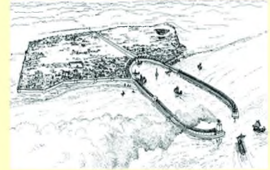
2.yüzyıl Pompeiopolis Limanı (C. Brandon) NAUTICAL ARCHAEOLOGY, 39.2, 392.2

Dalgakıranların uzunluğu 320 metre, dalgakıran açıklığı ise 180 metredir. 1. yy. sonunda başlayıp 2. yy. ortasında inşası tamamlanan Pompeiopolis limanının yapımında Napoli-Puteoli körfezi çevresinde bulunan ve Roma Dönemi Akdeniz limanlarında yaygın olarak kullanılan volkanik külün (pozzolana harcı) varlığı ROMACONS (Roma Deniz Betonları) projesi ile saptanmıştır. Alüminyum silikatlar açısından zengin olan bu kül, su içinde kireç ile tepkimeye girerek bir dizi hidratlı kalsiyum alüminat ve silikatlar üretir. Bu maddeler su altında karbondioksit yokluğunda harcın agrega ile katı bir kütle haline dönüşmesini sağlar.