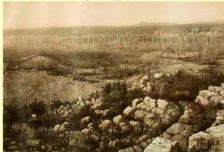
Pompeiopolis'in Tiyatro'dan Görünümü (yaklaşık 1862-1868).

Helenistik Çağ, Soli'nin en parlak dönemlerinden biridir. Büyük İskender İ.Ö. 333'te Soli'yi İssos'ta Perslere karşı kazandığı zafer öncesi hiçbir direnişle karşılaşmadan ele geçirmiş ve Tarsus'ta neredeyse ölümüne neden olabilecek ateşli bir hastalıktan kurtulduğu için Soli'de Asklepios'a kurbanlar sunmuştur. Ayrıca ordusuyla geçit düzenleyip, meşale koşusu, müzik gösterileri ve spor yarışmaları yaptırmıştır (Anabasis 2.5.7). İskender Soli halkını Perslere karşı eğilimlerinden dolayı 200 gümüş talanton para ile cezalandırmış ve kente halk egemenliğine dayalı bir yönetim başlatmıştır. Helenistik Dönemde Soli'nin ünlüleri arasında, babası Tarsus'tan göç etmiş olan stoacı filozof Khyrsippos; güldürü şairi Philemon ve nazım tarzında yazılmış olan "Phainomena" adlı yapıtın yazarı Aratos vardır (Strabon 14. 5. 8).