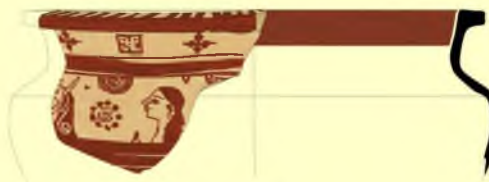
Arkaik Dönem Fikellura Krater Parçası

Soli Höyük'te 15-13. yüzyıllara ait Luvice kişi adlarının olduğu yazılı belgeler vardır. İ.Ö. 15. yüzyıl Muwazi mühür baskısı, İ.Ö. 14. yüzyıl kent beyi Targasna'ya ait kulp baskısı ile İ.Ö. 13. yüzyıl Parnapi adlı bir askerinin mühür baskısının bulunduğu yakma küp mezar Geç Tunç Çağı'nda Soli'de güçlü sınıfsal bir yapının olduğunu gösterir. Bu tabakalara özgü buluntular arasında en tipik olanları tek renkli yiv işaretli kaba kaplar, ip baskılılar, kafes bezemeliler, dalga bezemeliler, Kıbrıs üretimi beyaz astarlı süt kapları ile kırmızı parlak perdahlı kült kapları (matara, kol ve şişe biçimli) bulunmaktadır. Ayrıca iki yüzü balta ve orak biçiminde işlenmiş kumtaşı maden kalıbı Soli'de Geç Tunç Çağı'nda maden üretiminin varlığını gösterir. Soli'nin İ. Ö. 2. bindeki adının Ellipra ya da Ura olabileceği hakkında görüşler öne sürülür.