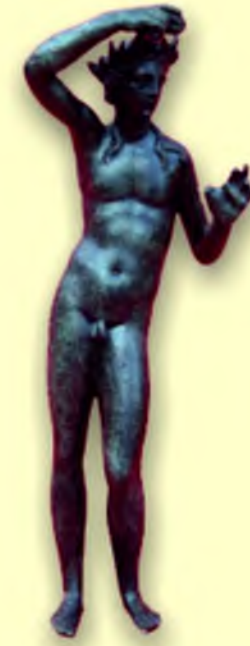
Roma Dönemi Apollon Heykelciği

Sütunlu Cadde'de opus sectileli taban döşemeleri, apsisi iki sütun arasında yerleştirilmiş küçük kilise ile altın takı koleksiyonu Erken Bizans Döneminin en önemli buluntularıdır. 525 depremi öncesine tarihlenirler.