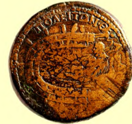
Antoninus Pius Sikkesi 143/144 (Nau. Arch. 2010, 395)

Pompeiopolis limanına son biçimi Hadrianus Döneminde verilir. 143/144 yıllarında kentin Pompeiopolis olarak kuruluşunun (İ.Ö. 66/65) 209'uncu yıldönümünde basılmış Antoninus Pius sikkesi üzerinde son hali görülür. Bu sikkede limanın içinde uzanmış tanrısal figürün yerel bir ırmak tanrısını temsil eden bir tanrı; liman ile ilgili Portunus, Okeanos ya da her üçünü temsil eden bir tanrı olduğu düşünülür. Sikkede yakından bakılırsa, Pompeiopolis limanı iki katlıdır. Batı dalga kıranının ucunda deniz feneri, doğu dalgakıranının ucunda ise elinde asa tutan bir diğer tanrı heykeli görülür. Liman çatısı üzerinde düzenli aralıklarla yerleştirilmiş küp benzeri nesnelere ilk iki küp arasında ateş flaması yer alır. Bunların limanın aydınlatılmasında kullanıldığı sanılmaktadır.