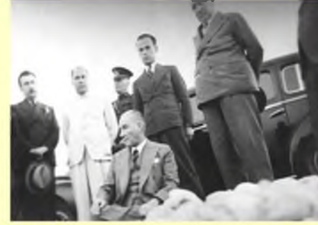
Mustafa Kemal Atatürk'ün Soli Pompeiopolis Gezisi 21 Mayıs 1938

Soli, İ.Ö. 70'lerde Armenia kralı Tigranes'in saldırısına uğrar ve halkı, onun yeni kurduğu başkenti Tigranokerta'nın bayındırlığında çalıştırılmak üzere göçe zorlanır. Soli halkı bu sürgünden sonra ancak İ.Ö. 68'de yeniden yurtlarına dönebilmiştir. İ.Ö. 67 yılı Soli tarihi için bir dönüm noktası ve yeni bir başlangıçtır. Pompeius tarafından yapılan düzenlemelerle Ovalık Kilikia (Cilicia Campestris/Pedias) artık Roma'nın egemenliği ve koruyuculuğu altına