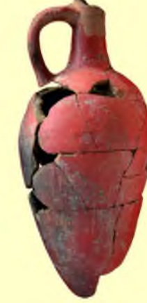
Hitit İmparatorluk Dönemi Testisik

İ.Ö. 2. binin ikinci yarısında Hitit İmparatorluk Döneminde Çukurova Kizzuwatna bölgesi içine girer. Kizzuwatna'nın batı, Tarhuntassa'nın doğu sınırında yer alan Soli Höyük Soli Höyük kazamatlı (kasa tipi) sur duvarları ile İ.Ö. 15. yüzyılda güçlü bir savunma sistemine sahiptir.