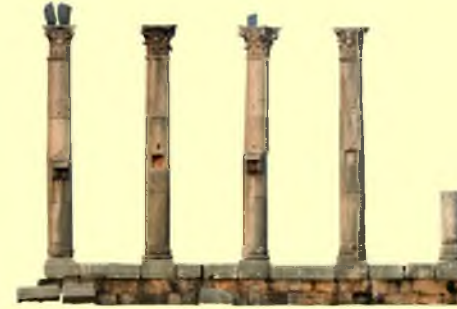
Pompeiopolis Batı Sütun Sırası

Soli Pompeiopolis sütun başlıkları Korinth düzenindedir. Bitkisel bezemeli olanlarının yanı sıra figürlerle süslenmiş olanları da vardır. Figürlü olanlar Yunan-Roma Pantheonu'nun örneklerini sergilemektedir: Zeus, Athena, Aphrodite, Artemis, Pan, Satyr, Dioskurlar... Sütun başlıklarının tarihlenmesi çoğunlukla Severuslar (193-235) dönemine ve genel olarak 2-3. yüzyıllara verilmektedir. 130 yılında Pompeiopolis'i ziyaret eden İmparator Hadrianus, başka yerlerde olduğu gibi burada da yapı faaliyetlerine öncülük etmiştir.